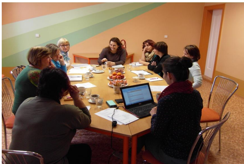
Obrázek 3 Pracovní skupina MŠ