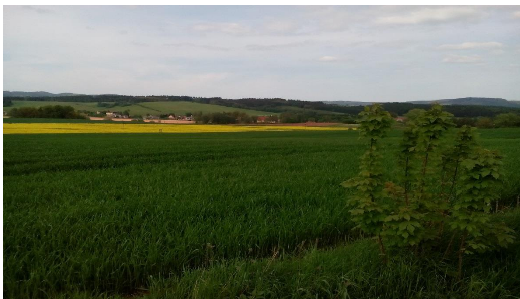
Obrázek 4 Z území MAS Broumovsko+

V rámci projektu MAP Realizační tým připravuje vzdělávací aktivity zaměřené zejména na předškolní vzdělávání, čtenářskou a matematickou gramotnost, inkluzivní vzdělávání a podporu dětí a žáků ohrožených školním neúspěchem. V roce 2016 se uskutečnily dvě vzdělávací akce, obě 18. 11. 2016. Tématy bylo Dítě s vývojovou dysfázií a Dítě s narušenou komunikační schopností. O vzdělávací akce byl velký zájem, další vzdělávací aktivity se plánují na rok 2017. Bude se jednat například o pomoc MŠ se zpracováním školního vzdělávacího programu, čtenářskou a matematickou gramotnost, kooperativní výuku a další.